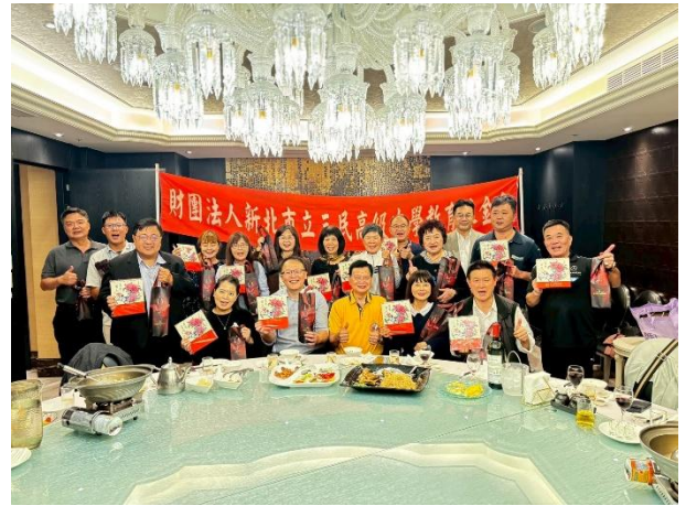
董事、顧問、校內工作人員全體大合照