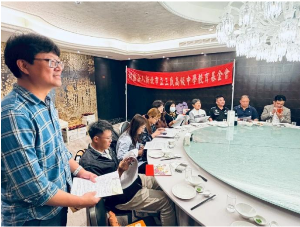
執行秘書工作報告及議案說明