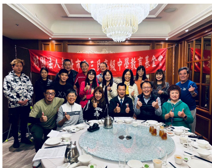
董事、顧問、校內工作人員全體大合照