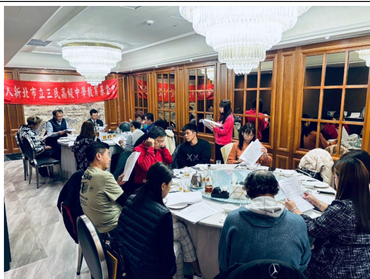
執行秘書工作報告及議案說明